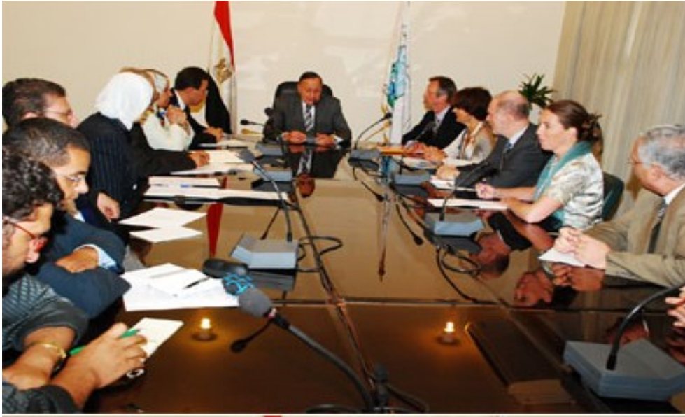
صورة (٢٣-١) بحث سبل التعاون البيئي مع المملكة الهولندية

تمت دراسة تقرير البعثة الهولندية التي زارت مصر عام ٢٠١٠ لتقييم سبل التعاون مع عدد من الوزارات المصرية لحماية الدلتا وقد تم وضع رؤية لدور وزارة البيئة في هذه المبادرة ومقترح المشروعات التي يمكن القيام بها في هذا الشأن تمهيداً لمناقشتها مع الجانب الهولندي وكذلك المشاركة ( كمرقب ) في ورشة العمل الأولى ضمن فعاليات أسبوع المياه الذي نظمته السفارة الهولندية بالقاهرة في يونيو ٢٠١١.