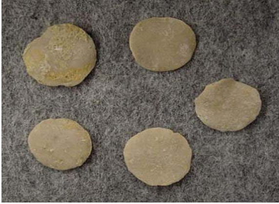
Ph. Protozoa Genus Nummulites