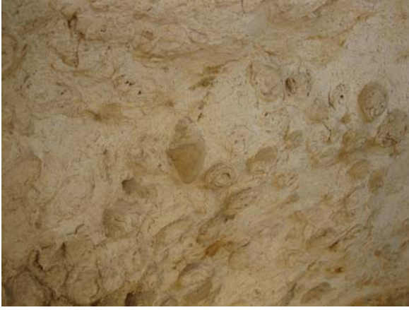
Ph. Mollusca Cl. Gastropoda Genus Acteonella