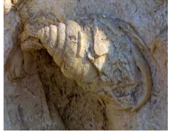
Ph. Mollusca Cl. Gastropoda Genus Volutomorpha