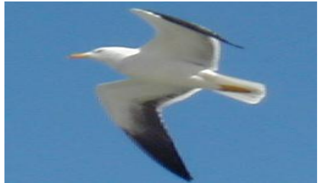
Lesser Crested Tern