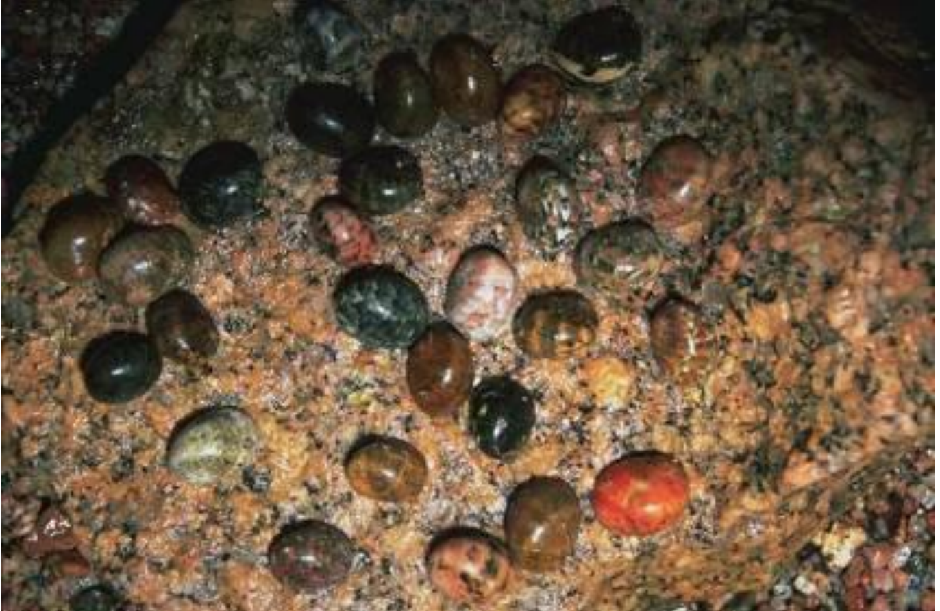
بعض أنواع القواقع التي تشتهر بها أبو جالوم