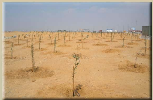
زراعات الأشجار بالمرحلة الأولى بطول ٤ كم