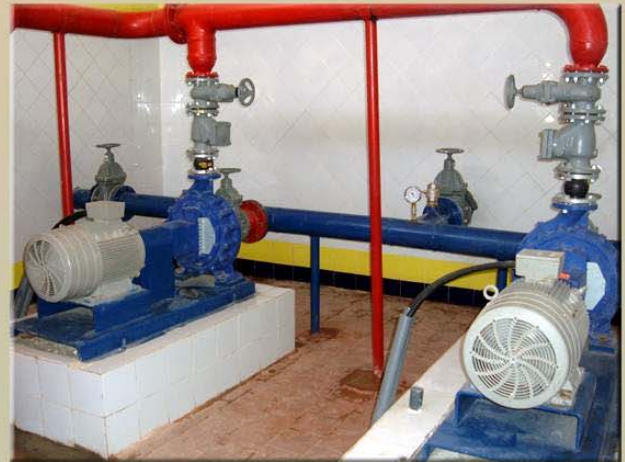
محطة الطلمبات الملحقة بالخزان الرئيسي لضخ المياه