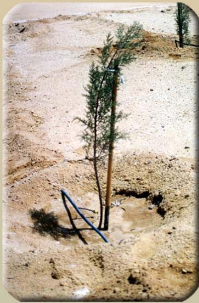
نظام الري بالتنقيط