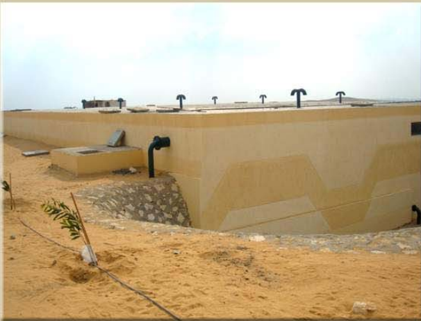
خزان المياه سعة ٢٧٥٠ م ٣