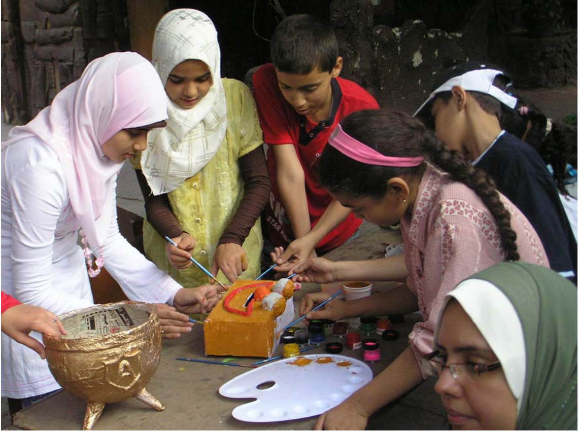
الأطفال يقومون بتلوين احد الأعمال الفنية من مخلفات الكرتون