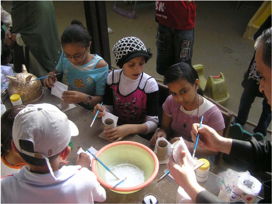
ورش العمل الفنية باستخدام مخلفات الكرتون