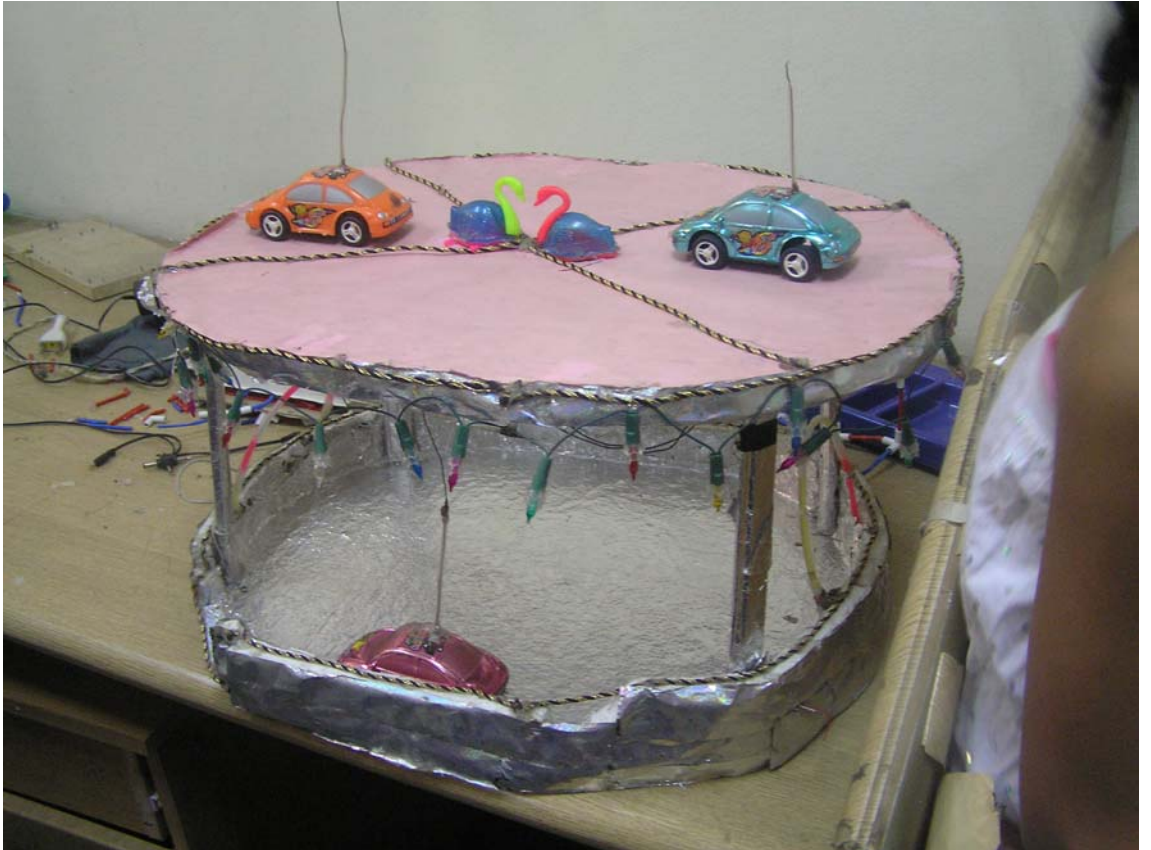
اصنع لعبتك بنفسك ( السيارات الكهربائية )