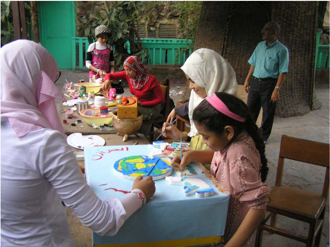
الأطفال وعمل فني يدعو للحفاظ على البيئة