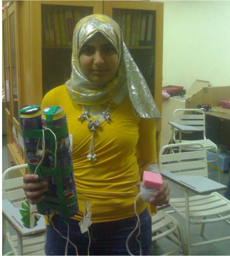
طفلة مخترعة معها جزيرة الاحلام