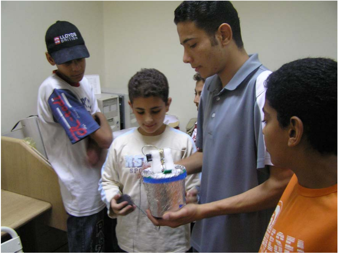
صناعة غسالة من المخلفات