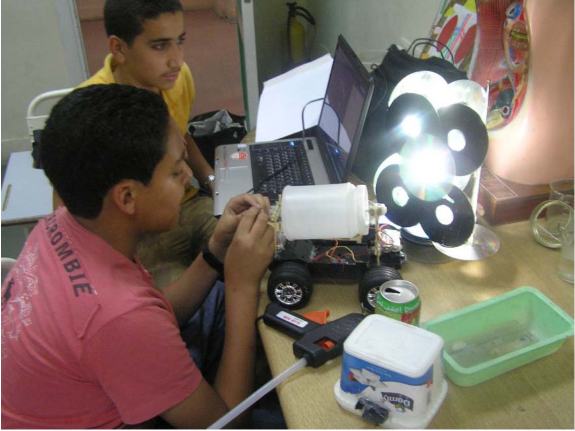
الأطفال أثناء تجهيز اختراعاتهم ( سيارة خاصة بإعادة التدوير+ اباجورة من المخلفات)