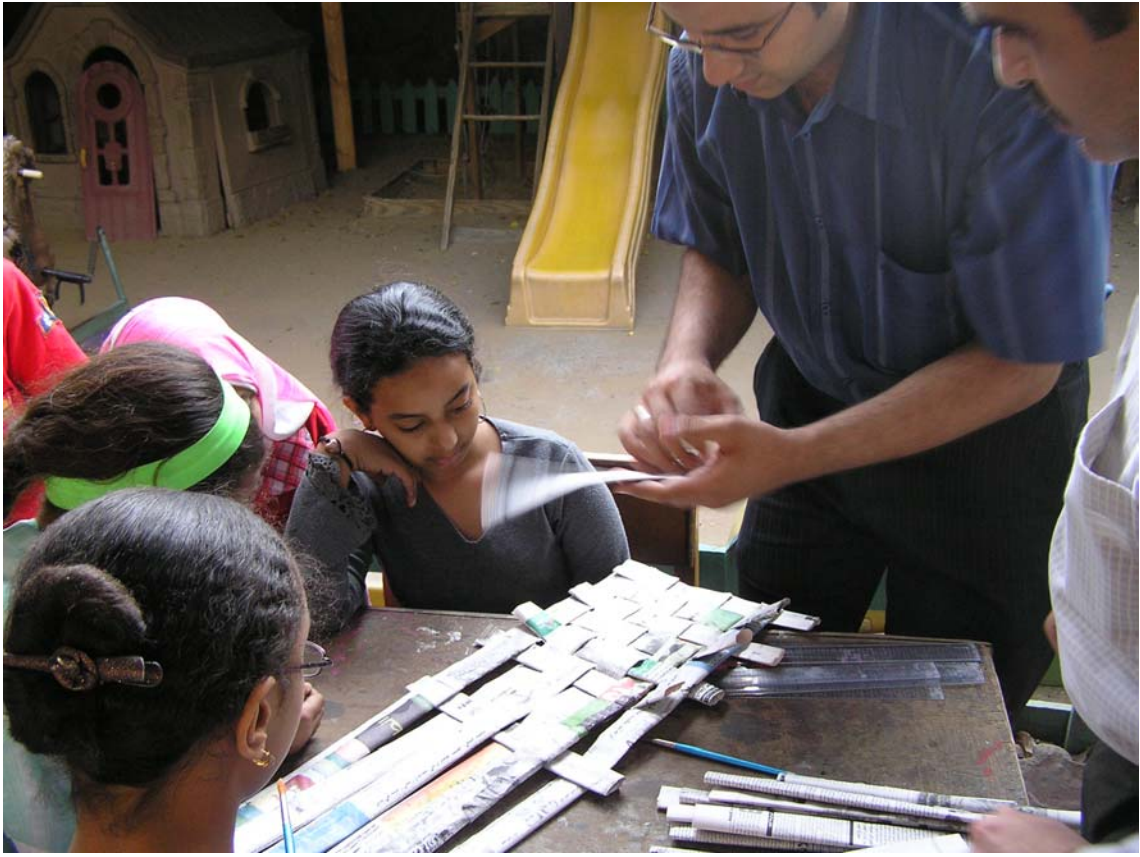
أعمال فنية من ورق الجرائد