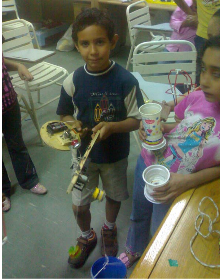
احد الأطفال المخترعين ( لعبة متحركة من المخلفات )