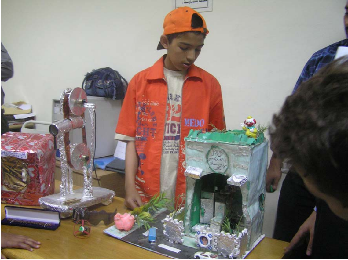
احد الأطفال المخترعين ومعه منزل حديث يعمل بالطاقة الشمسية من اختراعه.