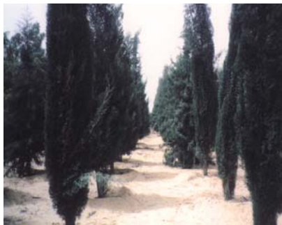
( Cupressus sp. )