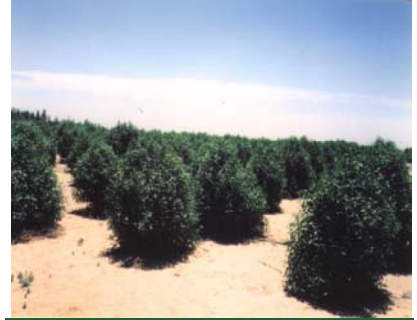
( Concarpus sp. )