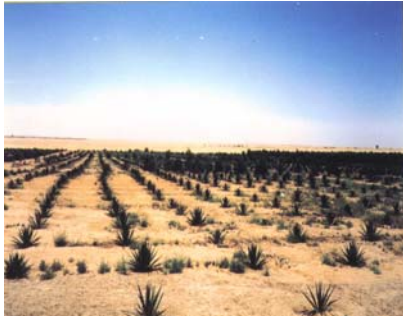
( Agava sisalana )