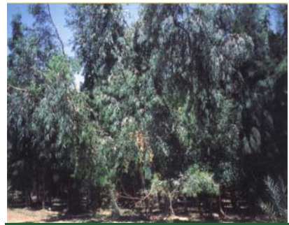
أشجار الكافور ( Eucalyptus sp. )