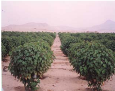
في غابة الأقصر ( Jatropha curcas )