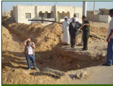
( - )