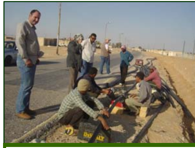
( - )