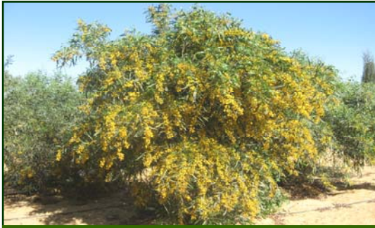
( - )