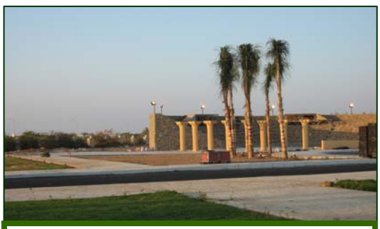
( - )