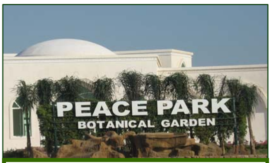
( - )