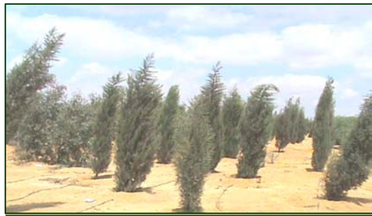
( - )