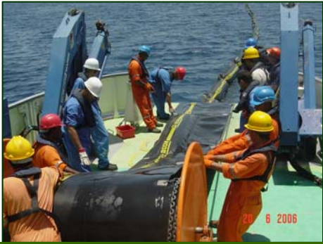
( - )